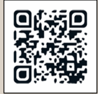
Carte quotidienne du risque incendie