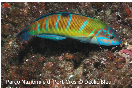
Donzella pavonina Octopus vulgaris

Il percorso sottomarino della Garonne riunisce ambienti di tipo diverso (rocce, fondali di Posidonia oceanica, mare aperto) che permettono l'osservazione di una grande diversità di specie. A ogni ambiente la sua boa pedagogica.