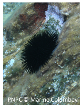
Ricchio maschio Arbacia lixula