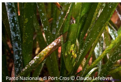
Posidonia oceanica Posidonia oceanica