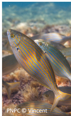
Salpa Sarpa salpa